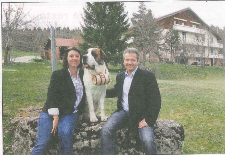
Aloha et ses maîtres vous disent «Aloha kakou».